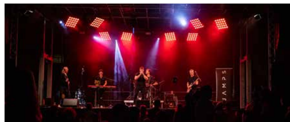
SCHULHOF 19:30 – 24:00 UHR JAMPS