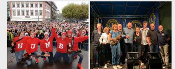
RATHAUS 19:00 – 19:30 UHR DIE HUMBAS 19:30 – 22:00 UHR LEVEL FREE

18:00 Uhr Öffnung der Weinstände und Höfe 18:30 Uhr Bühnenprogramm am Schulhof 19:00 Uhr Bühnenprogramm am Rathaus