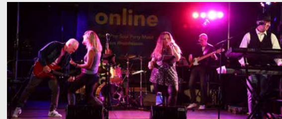
RATHAUS 19:30 – 24:00 UHR ONLINE

18:00 Uhr Öffnung der Weinstände und Höfe 19:30 Uhr Bühnenprogramm