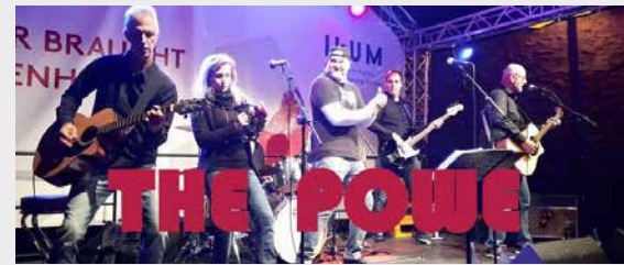
SCHULHOF 19:30 – 24:00 UHR THE POWER